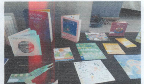
DIA ESTATAL DEL LIBRO Y DERECHO DEL AUTOR Y DE LA TIERRA