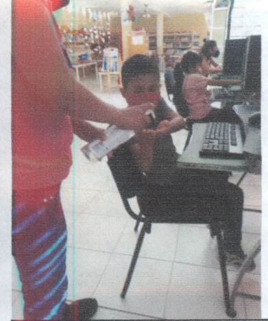
CURSOS DE COMPUTACION.