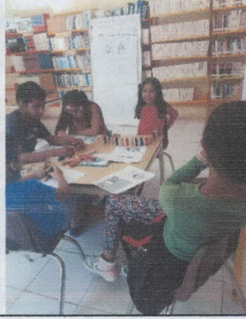
TALLER DE LECTURA "A GOLPE DE CALCETIN DE FRANCISCO HIJOS"