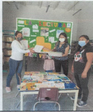
ENTREGA DE LIBROS ACATLAN DE OSORIO PUE.