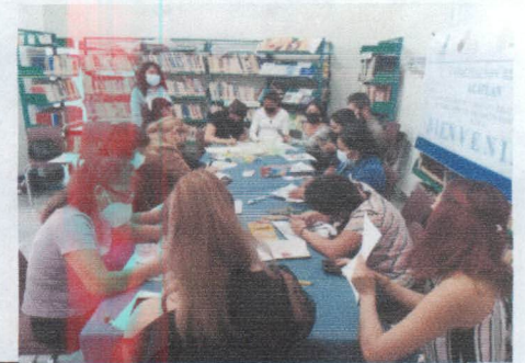
TALLER Y CAPACITACION, "EN PRIMAVERA LA BIBLIOTECA TE ESPERA".