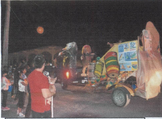
DESFILE DEL DIA DE REYES