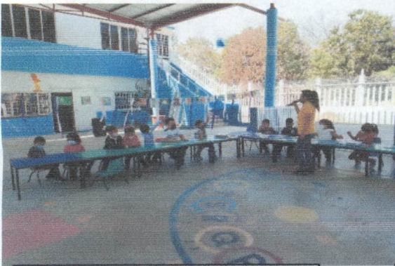
ACTIVIDAD EN EL PRESCOLAR DE ATAHUALPA.